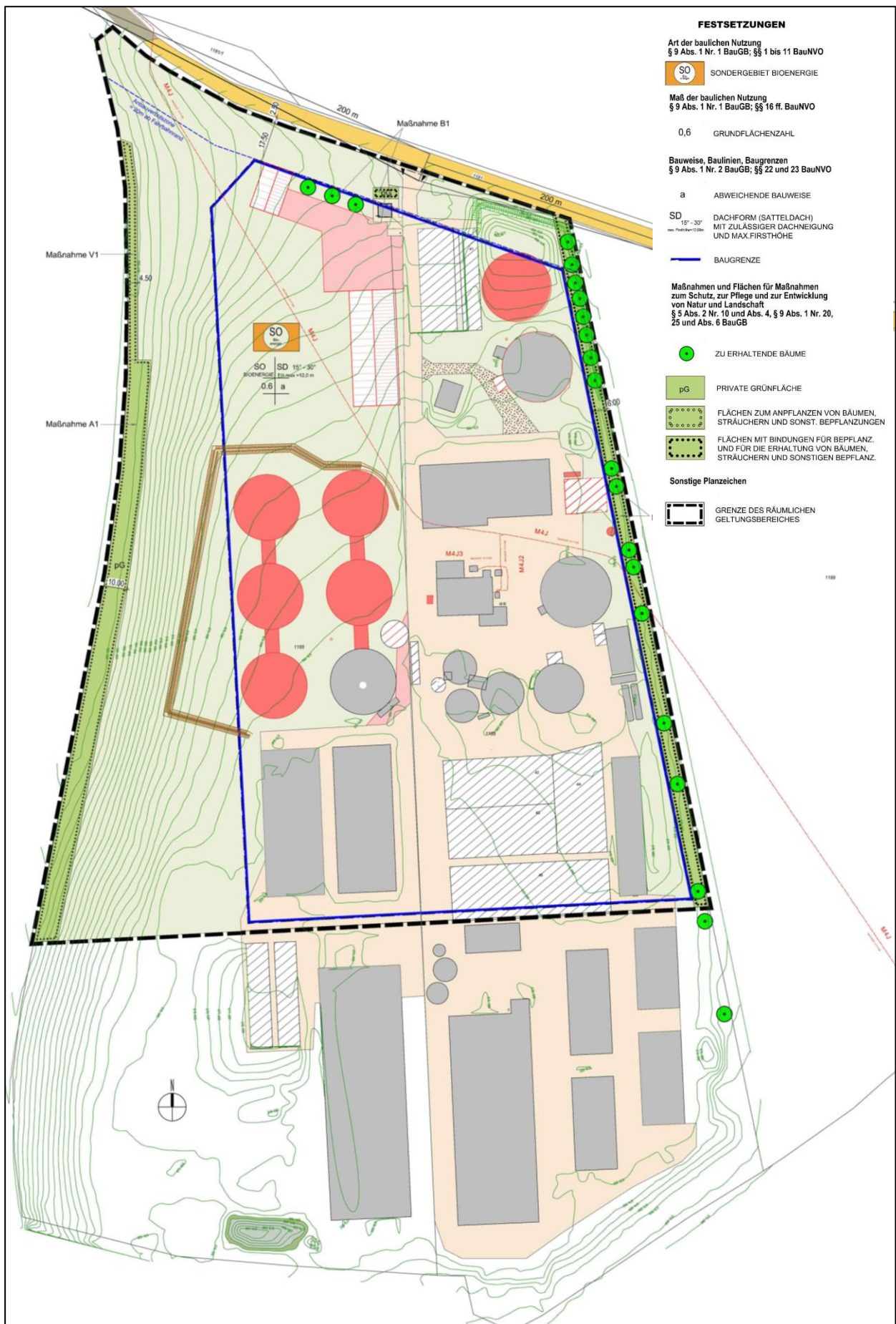
Abbildung 1: Planzeichnung B-Plan „Bioenergie Großried“ (Entwurf); Stand: 14.02.2024 (ohne Maßstab)